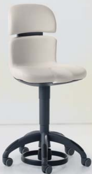
HUGO Freehand: Пожная регулировка высоты сиденья, цветовая гамма – «Elegant»