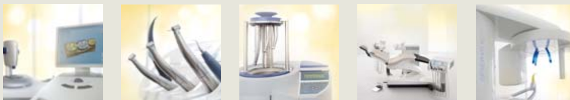
CAD/CAM СИСТЕМЫ | ИНСТРУМЕНТЫ | АППАРАТЫ ДЛЯ ГИГИЕНЫ | СТОМАТОЛОГИЧЕСКИЕ УСТАНОВКИ | СИСТЕМЫ ВИЗУАЛИЗАЦИИ